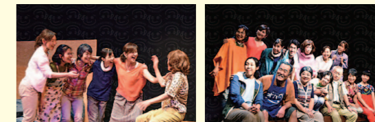
【「明日葉の庭」公演より】

ホームページ https://shibaiyagakuya.jimdosite.com/