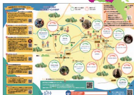
▲イベントMAP (スタンプラリー)