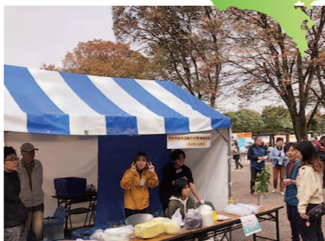
▲ 2019年度の事業の様子

羽村市では、市内の団体、事業者、個人が行うイベントなどで利用可能な、バイオマスプラスチック製の食器を含むリユース食器の貸出しを行っています。2021年度は、新型コロナウイルス感染症拡大に伴い、各種イベントが中止となり、貸出し件数は1件となりましたが、今後もリユース食器の利用を促進し、廃棄物となる使い捨て容器を削減することで、低炭素な事業や生活を推進していきます。使用後の食器は洗浄不要で返却するだけなので、利用者からは「ゴミも出ないし、エコで便利！」という声をいただいています。