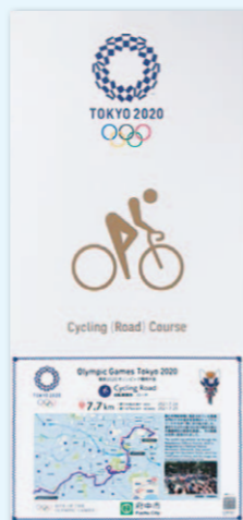
自転車ロードレース 銘板

多摩地域を横断して行われた自転車ロードレースは、武蔵野の森公園をスタートし、静岡県の富士スピードウェイをゴールとするコース(総距離は、男子約244km、女子約147km)で、歴代の大会の中でも起伏にとんだコースだったそうだよ。