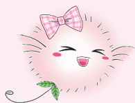
マスコット像 (高さ約150cm程度)

大会期間中に、東京都が設置した大会マスコット像を所在する自治体が譲り受け、来訪者の多い場所に再設置したんだ。 多摩・島しょ地域でも様々な場所で見ることができるよ。