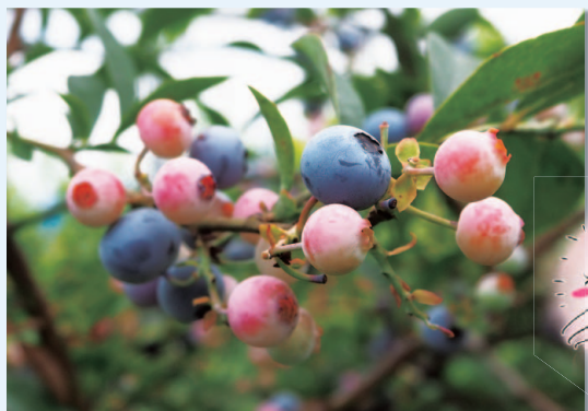
取材協力: 美園フルーツファーム

ブルーベリー栽培発祥の地である小平市では市内あちこちでブルーベリーを栽培しているよ。おもにラビットアイ系という、熟す前はウサギの目のような赤い実をつけるブルーベリーが春から秋まで店頭で並ぶよ。