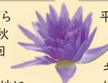
キング・オブ・サイアム

園の最大の見どころはばら園で、春(5月~7月)と秋(10月~11月)の年2回バラが最盛期だよ。16ヘクタールの広大な敷地に見渡す限りのバラが咲く様子は圧巻だよ。