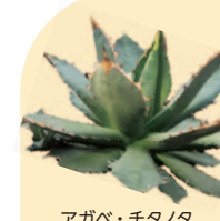
アガベ・チタノタ

園内はばら園、つつじ園、うめ園、はぎ園をはじめ、植物の種類ごとに30ブロックに分けてられていて、約4,800種類、10万本もの草木が植栽されて季節ごとに異なる花を見ることができるよ。園には京王線調布駅やJR中央線三鷹駅からバスでアクセスできるほか有料駐車場も併設されているよ。