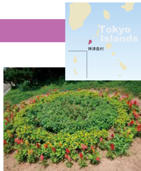
Tokyo Islands 神津島村