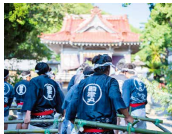
神津島「神事かつお釣り」