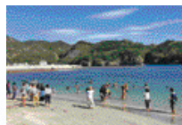
父島・母島「海びらき」