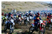
三宅島「WERRIDE 三宅島エンデューロレース」