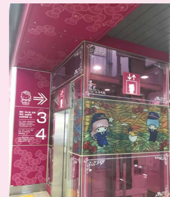
エレベーターにも!