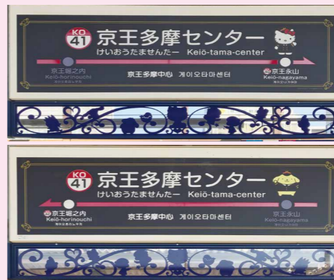
駅名看板にキャラクターが!

京王多摩センター駅は、サンリオピューロランドの最寄り駅の一つだよ。2016年3月にハローキティが名誉駅長に就任して、駅構内もヨーロッパの町並みをモチーフにした空間に一新されたんだ。駅の色々な場所で、サンリオのキャラクターたちが出迎えてくれるよ!ボクが見てきたところをちょっとだけ紹介するね!