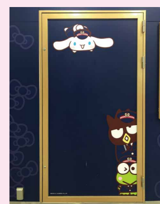
記念撮影ができそう?