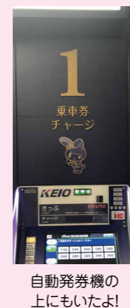
自動発券機の上にもいたよ!