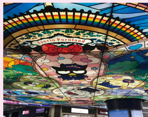
改札を出ると、ステンドグラス風の天井照明が!