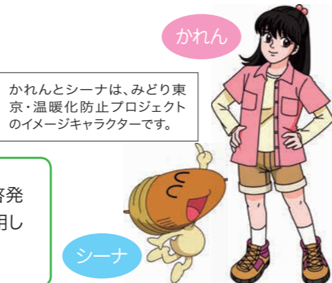
かれんとシーナは、みどり東京・温暖化防止プロジェクトのイメージキャラクターです。

本プロジェクトでは、自然環境保護及び地球温暖化防止についての普及・啓発を目的とする市区町村の自主事業に対する助成を行っています。本助成を活用して多摩・島しょ地域の自治体で実施された事業を紹介します。