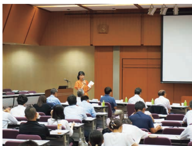
▲審査会委員からの講評