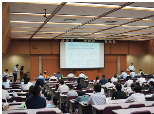
▲自治体担当者による報告の様

なお、平成30年度の助成内容及び助成事業詳細につきましては、本誌6月号(No.57)P4~7をご覧ください。