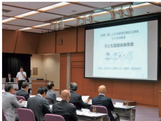
▲自治体担当者による報告の様式

なお、平成29年度の助成内容及び助成事業詳細につきましては、本紙6月号(No.045)P5~8をご覧ください。