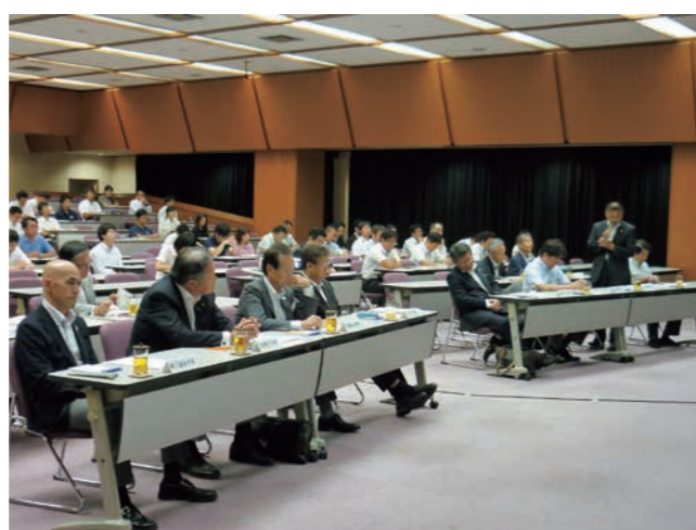
▲審査会委員からの講評