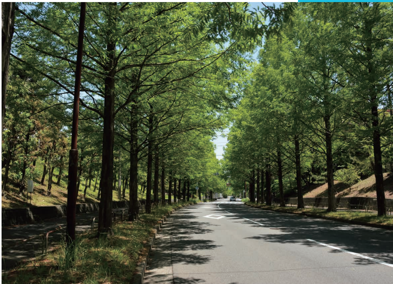
[タイトル] 多摩のさんぽ道 [撮影場所] 多摩市鶴牧 メタセコイア通り