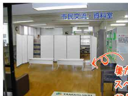
▲府中駅北第2庁舎6F 多摩交流センター 市民交流室