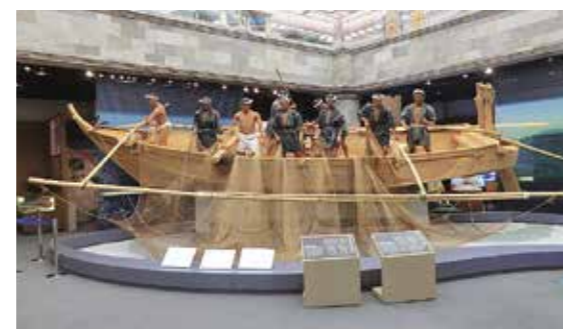
博物館センター展示「棒受網漁、六挺張りてんま船」

東京都島しょ町村において、唯一「係」として職員を配置している博物館で、活動も多方面にわたります。村のこれまでの歩みが解説を含めて分かりやすく展開されているなど、よく作り込まれた常設展があります。日頃の調査・研究の成果などを期間を区切って展示する企画展・特別展、島の古老に講師を依頼する体験型の事業なども豊富に展開しています。村民のみを対象とせず、島外からの来館者もターゲットにしています。