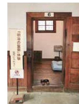
明治時代の独房体験ができる

ちなみに、明治時代に愛知県豊橋市出身の村井弦斎によって書かれた小説「食道楽」に出て