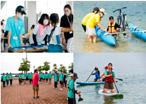
▼図表3 今治海kids倶楽部の活動の様子

市としても今治港が交流の拠点として賑わい続けるよう、また、NPO法人ICPCの市民の交流の場としての機能を活かし、市の各事業にも市民に積極的に参加してもらえよう連携を強化していきたいと考えています。