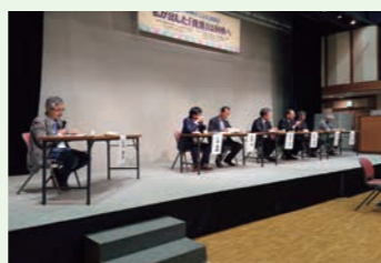
▲パネルディスカッション