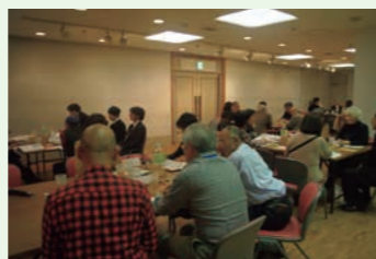
▲ワークショップの様子