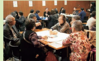
▲昨年のワークショップの様子