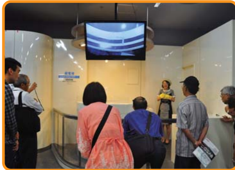
●東芝科学館見学(超伝導の実験)

エネルギーと電気を学ぶ 施設見学バスツアー ・日 程 ①9月19日 ②9月25日 ・参加者 ①23名 ②22名