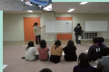
他大学との交流会