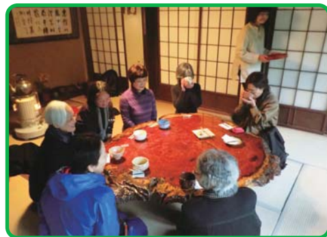
●日の出山荘青雲堂 お抹茶体験

当講座では、午前中、雨天により現地での竹林伐採は中止になったものの、東京都森林組合で森林環境について学び、竹を利用した苗木ポットづくりを体験しました。午後は、日の出山荘に移動し、書院や庭園などの見学と、青雲堂でのお抹茶の体験をしました。