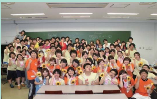
学生も笑顔で活動

多摩地域で活動している身であるかぎり、子どもたちの笑顔、学生の笑顔からまちが活気づいていけばと願っています。