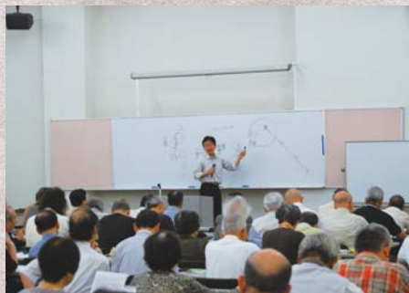
毎回、充実した講座でした。

「多摩のかけはし 8月号 No.109」で募集した「第16回 多摩の歴史講座」(東京市町村自治調査会多摩交流センター・たましん地域文化財団共催)、今年度は「八州廻りとアウトロー」をテーマに9月26日から11月21日にかけて隔週水曜日の全5回を国分寺労政会館他で開催いたしました。応募者150名のうち抽選で、46歳から88歳までの120名の受講生の皆様にご参加いただきました。