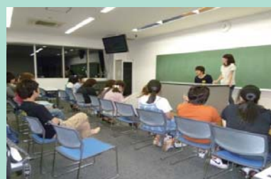
校内活動 手話講習

現在は校内での活動がほとんどですが、これから少しずつ活動の範囲を広げ、様々な人に手話の良さや面白さを知ってもらいたいと考えています。