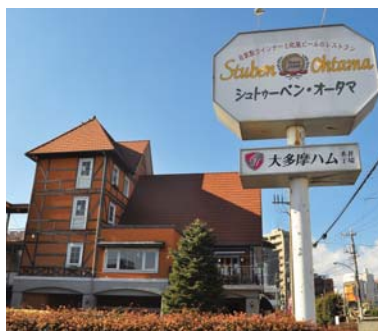
ドイツのローテンブルク調のシュトゥーベン・オータマ

大多摩ハムは、環境に対する取り組みや地域との連携も積極的に行っています。環境に対する取り組みでは、工場の重油ボイラーを、電熱供給システムと簡易ボイラーに変更し、年間114トンの二酸化炭素排出量の削減効果が見込まれることが評価され、農林水産省の「食品産業CO 2