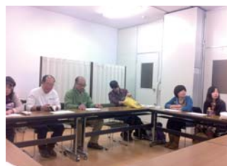
12月に行われた定例会の様子

福島出身者がメンバーに加わり、福島へのボランティアをするようになった。「花咲かプロジェクト」で、岩手県では種を直播きしていた。だが福島へは「プランターを持って行き、そこに土をいれて種を蒔く」ようにしている。福島では除染する場合もあるので、直播きはできない。大船渡よりは近いので「行ける」確率は高くなる。