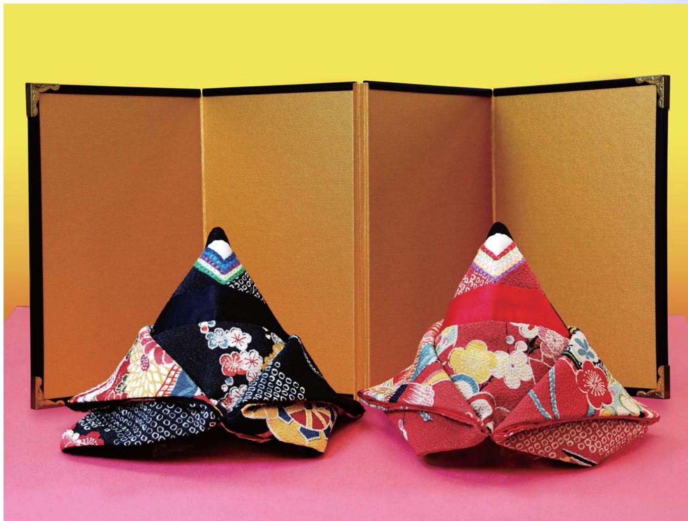
「ひな祭り」(楽しいパッチワークキルト会員作品)