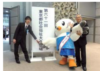
東京都社会福祉大会にて(表彰式)