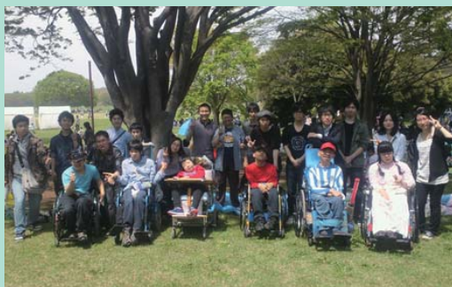
昭和記念公園へ遠足

今後も、一つ一つの活動を「みんなが楽しめる、温かい雰囲気」にし、それを維持していくことを目標に活動していきたいと考えています。