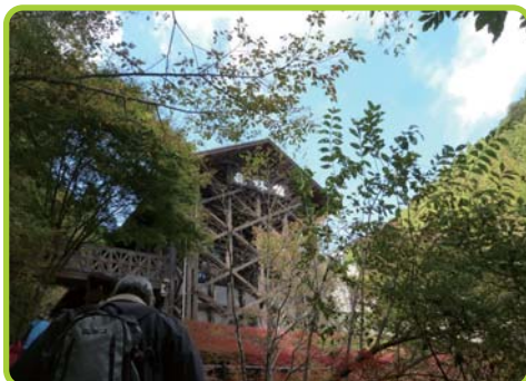
●都民の森でのガイドウォーク(森林館)

檜原村森林セラピー ・日 程 ①10月26日 ②10月31日 ・参加者 ①25名 ②20名