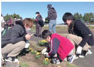
福島県南相馬市の仮設住宅前の 植え込みに花を植える

活動は、被災者と一緒 に仮設住宅の周りにお花を 植える「花咲かプロジェクト」、放射線の影響でなかなか遊べない子どもたちと遠足へ行く「移動保育」、武蔵野市に避難してきた避