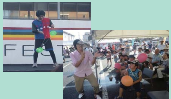
イベントでジャグリング披露

パフォーマンスは、パフォーマーが1人で演技をしても、なかなかその場は盛り上がりません。観客の拍手や驚きの声、歓声など、演技を見ている観客と一緒に盛り上がり、楽しい時間を過ごすことができるといふことにやりがいを感じながら、日々精進しています。