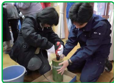
●竹の苗木ポットづくり