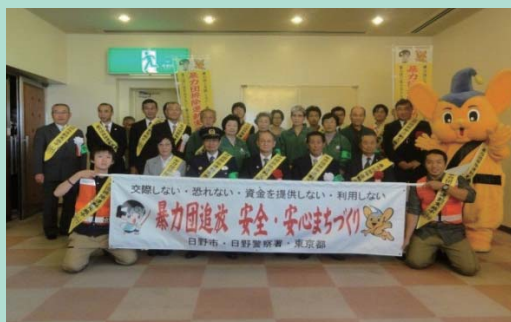
安全安心まちづくり運動に参加

MCATはMeisei Community Action Teamの略で、明星大学の学生有志で構成された地域のために活動する団体です。主に、地元日野警察署と日野市役所が推進している「安全安心まちづくり運動－防犯・防災・交通安全－」に協力して地域貢献活動を行っています。また、自主的な活動としては、授業の空き時間を利用して週3回大学近隣住宅街の見回りと清掃、小学生の下校時の声かけなどを行っています。