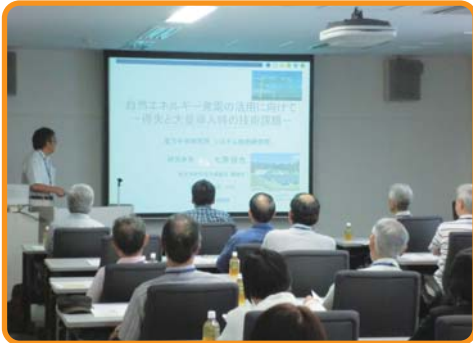
●電力中央研究所講義