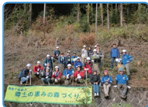
●植樹体験を終えて

当講座では、午前中、森林レンジャーあきる野のガイドで城山に登り、里山の森林環境の様子などを観察しながら秋川渓谷瀬音の湯まで下りました。午後は、瀬音の湯の敷地内で森林レンジャーから景観整備と植樹についてレクチャーを受け、森づくり体験をしました。